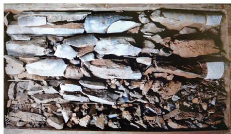
图3 中部破碎岩心照片

(2)中部地层破碎(见图3)、岩溶发育,溶洞高度达5~19 m不等,造成大量工作报废,同时影响工期进度。