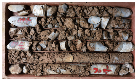
图2 上部破碎岩心照片